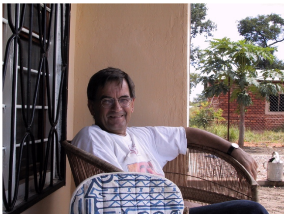
Huset i Urambo