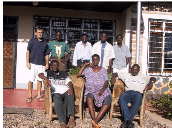
Herskab og tjenestefolk