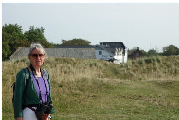
Mandøpiggen – det hedder caféen i baggrunden