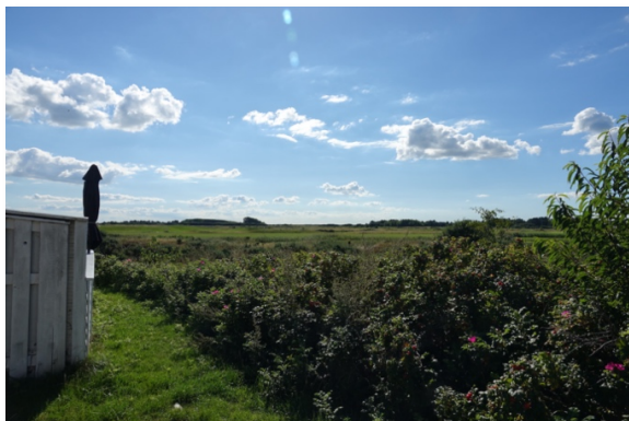
Udsigt fra huset på Rømø til golfbanen

Vi var i Toftum, 10 km nordpå i går for at se Kommandørgården. Nord-modvind hele vejen mod nord, og minsandten om ikke vinden var vendt rundt, delvis i hvert fald, på hjemturen.