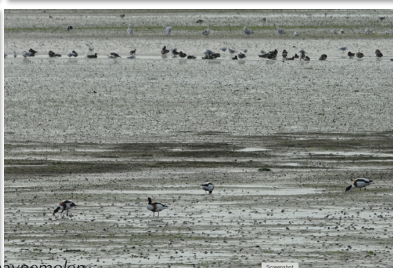
Sidste tur til havnemolen