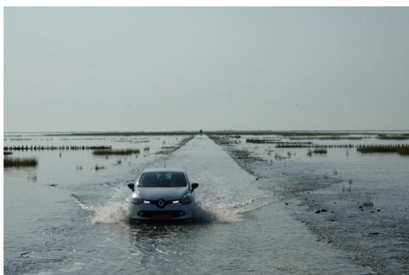
Det går mod flod – vandet stiger