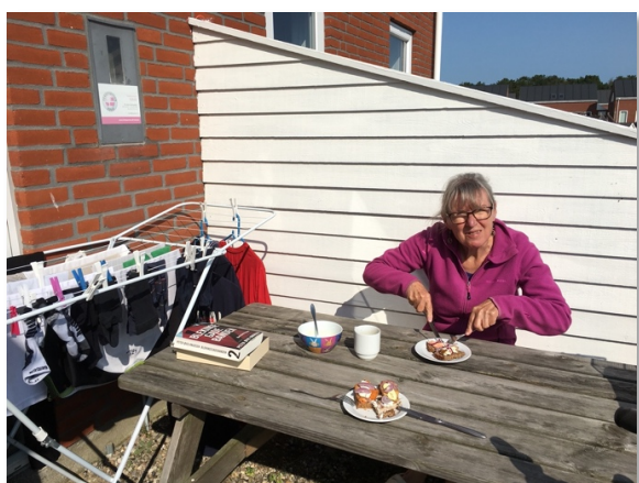
Frokost i middagssolen

Søndag drog vi østpå og løb en orienteringsbane ved DM Lang. Fin skov, fin tur, fint arrangement