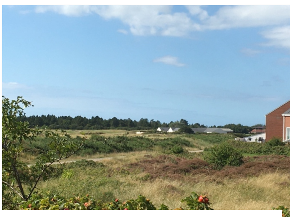
Udsigt fra huset på Rømø