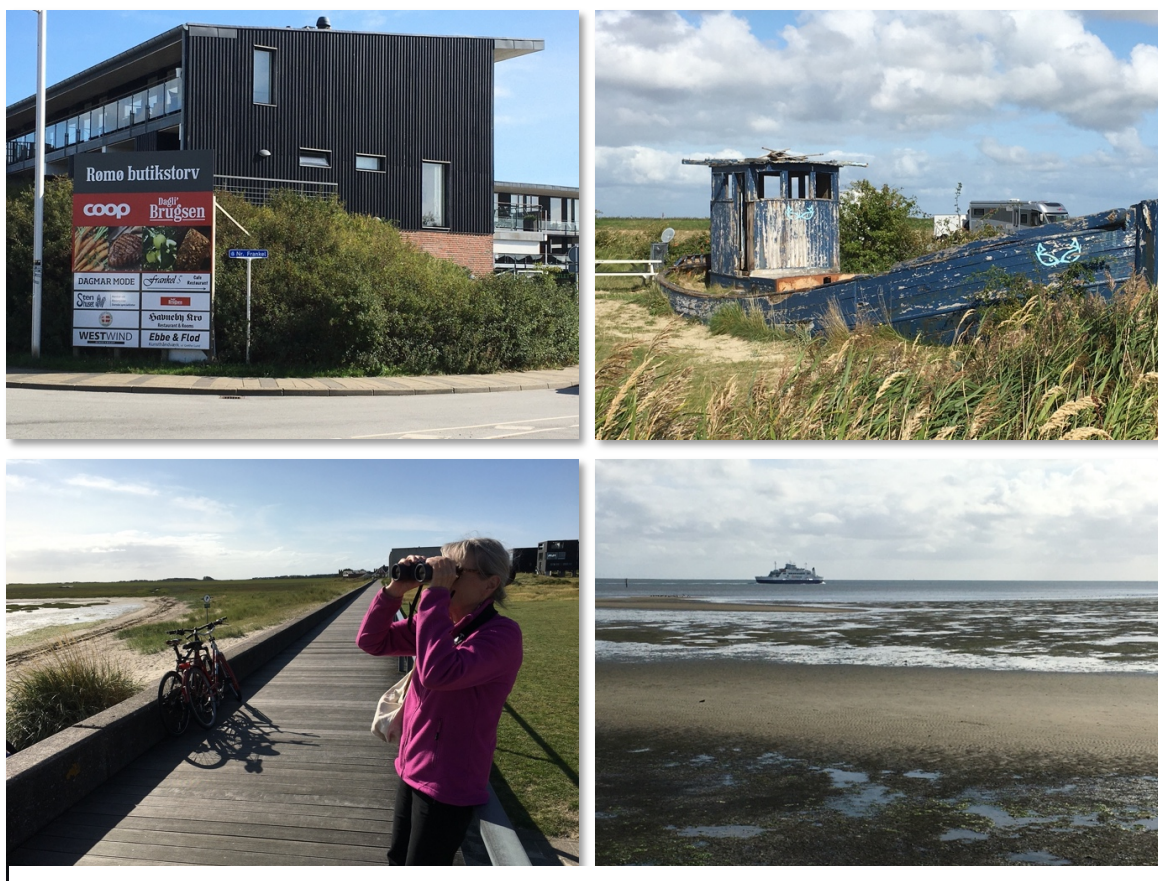
Vandretur til byen og havnen