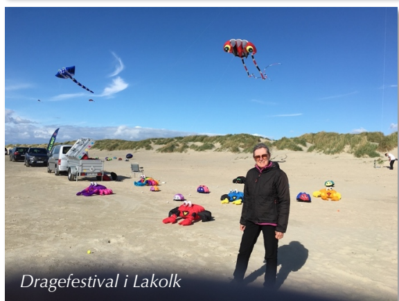
Dragefestival i Lakolk