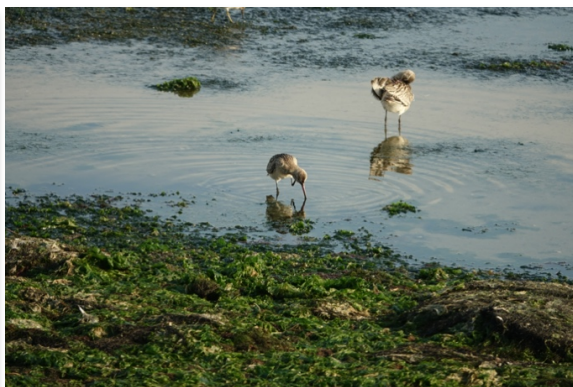
Vadehavsfugle fouragerer – Bekkasiner?