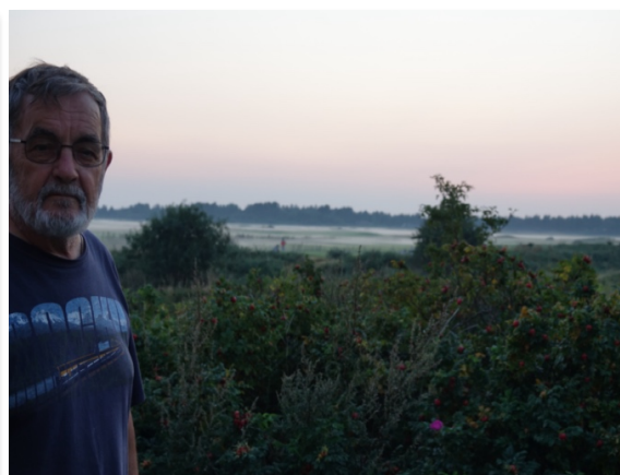
Solnedgang og mosekonebryg over Rømø