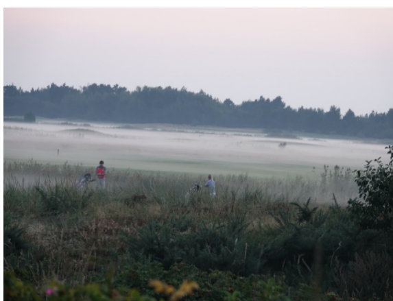
Mosekonen brygger over golfbanen