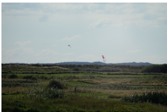
En surfer på stranden kommer til syne