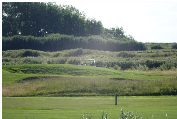
Endnu et kig til golfbanen