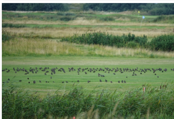
Cykeltur til Kommandørgården, Tønninggård Naturcenter og stære på golfbanen