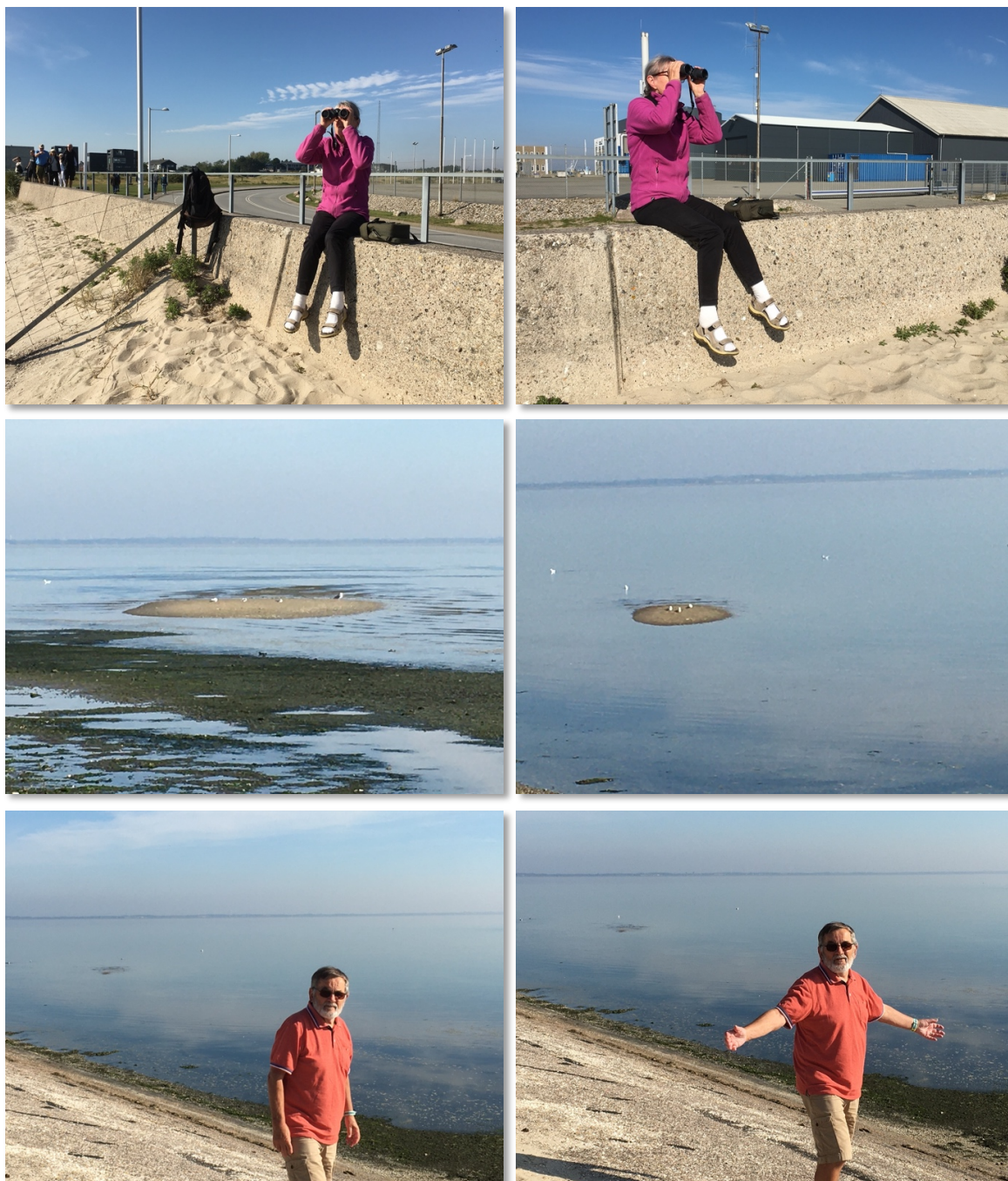
På molen i Havneby ved kanten af vadehavet, vores favoritsted

Tågen lettede over middag, så efter frokost tog vi på havnen for at se på fugle. Det var ebbe. I starten. Vi sad en god times tid på kanten og så vandet stige. Fascinerende syn.