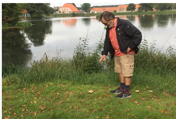
Søndagstur til Gram Slot og slotspark