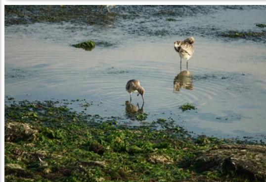
Et par vadehavsfugle mæsker sig i dyndet