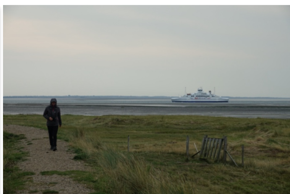
Vandretur på diget med udsigt til Sild-færge, golfere på golfbanen og vipstjert i haven