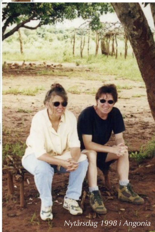
Nytårsdag 1998 i Angonia