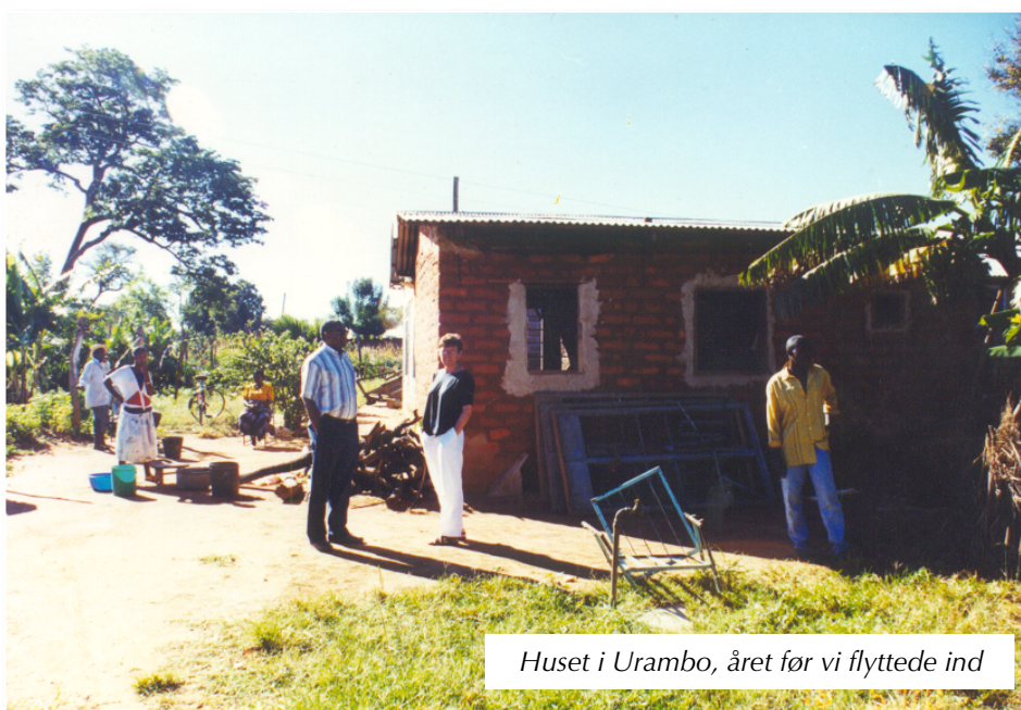
Huset i Urambo, året før vi flyttede ind