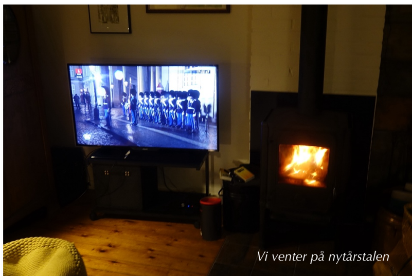
Vi venter på nytårstalen

Nu er 2020 snart slut, så herfra det lille hus i skoven ønsker vi et rigtigt godt nytår.