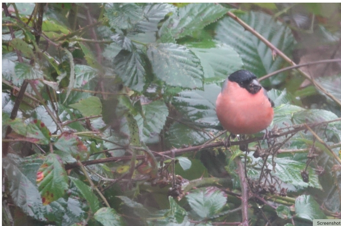
Dompap på besøg

Resten af dagen gik med en indkøbstur til Super Brugsen i Faaborg. Og, ikke at forglemme, at sidde stille en times tid ved husets panorama-vindue og kigge på en dompap, travlt optaget af at pille indtørrede frugter af buskene. Et flot syn.