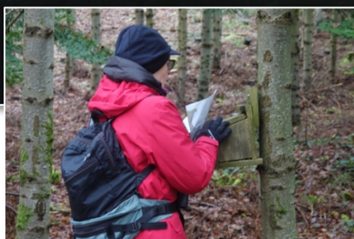
AM kigger på fuglekasse