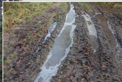
Der var is på vandpytterne