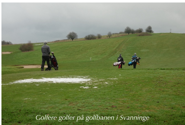
Golfere golfer på golfbanen i Svanninge

DMI havde lovet solskin kl. 15.00. Det holdt ikke, så vi måtte ud i gråvejr endnu engang. Der var dog lidt huller i skyerne, men også sne i luften nogen steder.