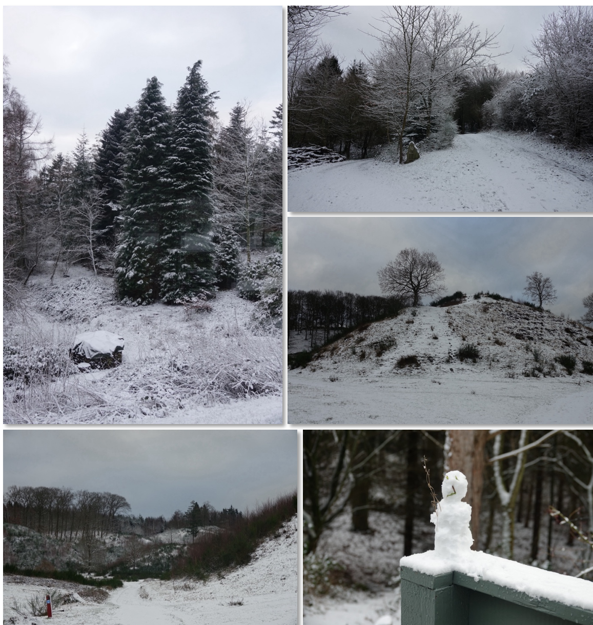
De sneklædte Svanninge Bakker

Her i bakkerne går vores ophold på sidste vers. Vi laver restemad i dag og i morgen, og drikker restevin, så vi har så lidt med i bilen som muligt, når vi lørdag formiddag vinker farvel til Højbolund 30. Det har været et meget fint ophold. Bortset fra min fibersprængning, som stadig giver mig lidt problemer. Det skal nok gå over med tiden.