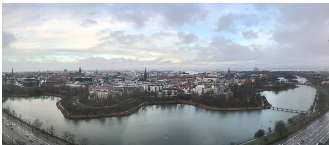
Udsigt fra 22. etage på Radisson Blu

Her viste det sig, at vi var blevet opgraderet til et Premium Room på 21. etage. Vi havde faktisk bestilt et Superior, men nu blev det altså til et Premium. Med en fabelagtig udsigt ud over byens tage. Selv Ungdomsøen kunne skimtes i det fjerne. Og Enhjørningens Bastion lå lige neden for vores vindue på 21. etage. Enhjørningens Bastion har vi brugt til Metr-O Cup, Amager OK's årlige byorienteringsløb, både i maj 2019 og i august i 2020, da corona-restriktionerne tillod den slags aktiviteter.