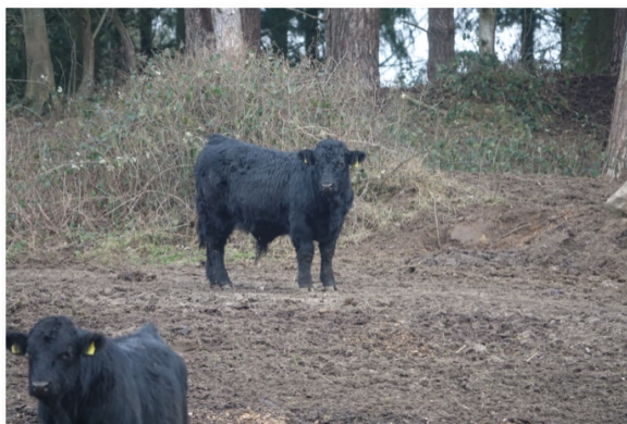
Wildlife i Høbbet

heldigvis, det kunne have haft fatale konsekvenser, mistede løven interessen, vendte om og gik tilbage i skjul. Tricket er naturligvis at bevæge sig så langsomt, at løven ikke kan følge med i de langsomme bevægelser. Det er lidt ligesom katten og musen. Katten kan ikke finde ud af fangsten, hvis ikke musen forsøger at løbe væk. Da vi var i sikkerhed, sagde guiden, at det ikke var rigtig farligt. Første gang en løve gør et udfald, er det ikke, fordi løven vil angribe, sagde han, det er kun for at markere sit territorium. Det var vi glade for at høre, for vi havde faktisk været ved at skide i bukserne. Men OK, den forklaring godtog vi.