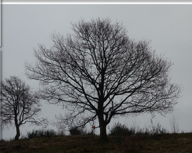
Vandretur i bakkerne