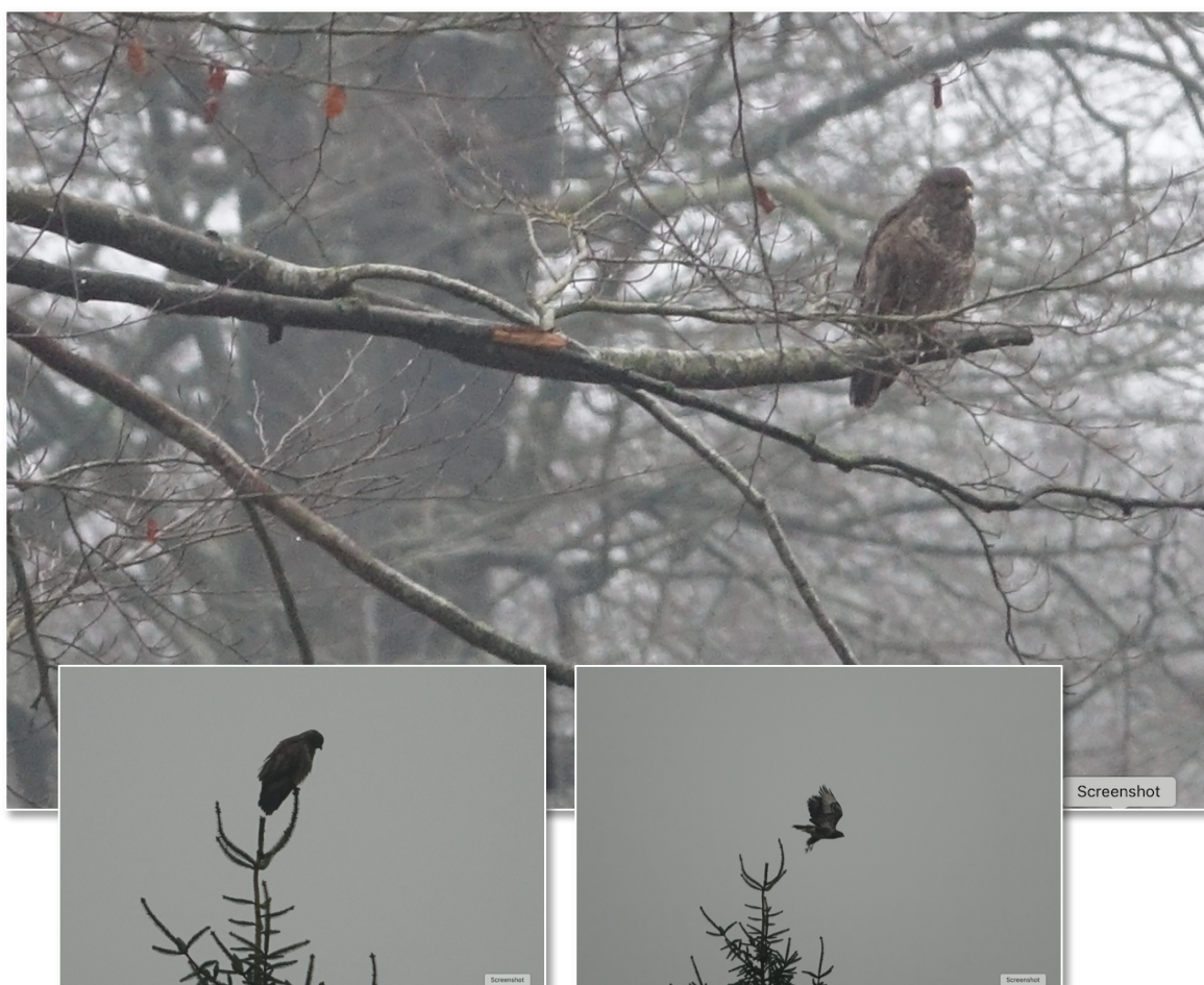
Musvåge-show i Svanninge Bjerge