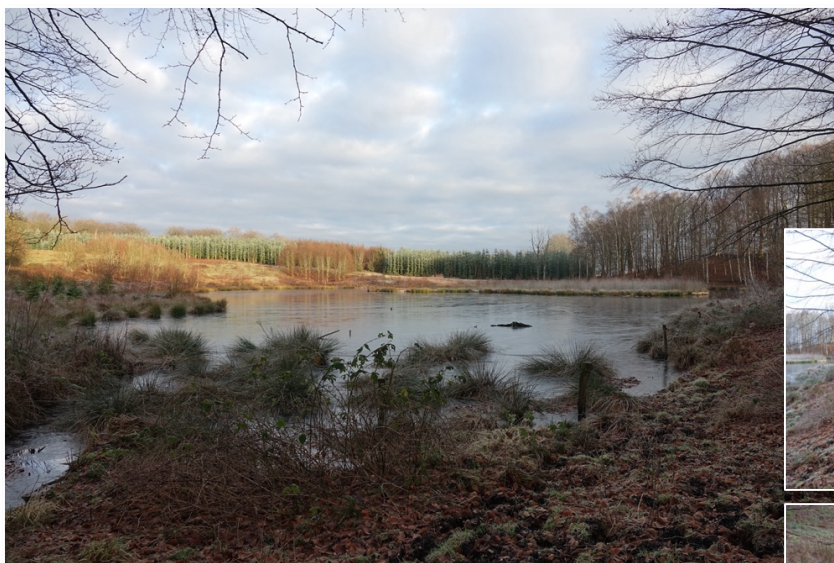
De bedste billeder fra en vidunderlig søndagsvandring i Svanninge Bjerge